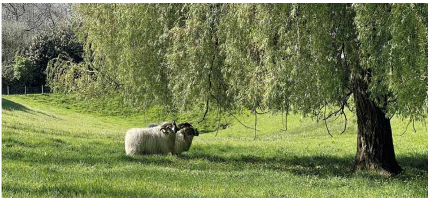
Avec l'arrivée du printemps, des silhouettes familières reprennent possession du paysage. Pour la quatrième année consécutive, la parcelle communale située à proximité des tennis accueille de nouveau ses résidents saisonniers qui vont l'entretenir : deux béliers et une brebis.