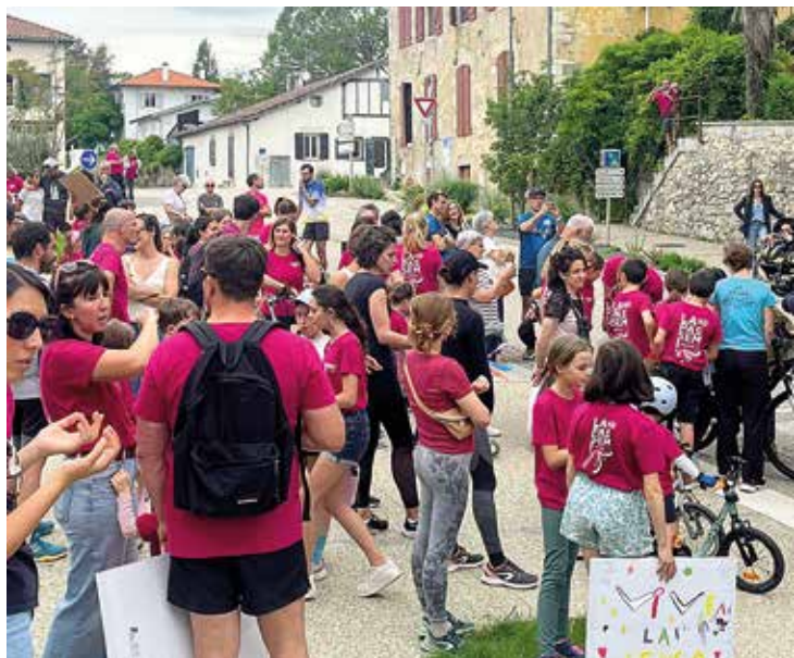
Vous avez été nombreux à accompagner la course de La Passem le 9 mai dernier. Bravo à tous les participants qui ont rendu ce moment joyeux et enthousiasmant autour de la langue et de la culture gasconne.