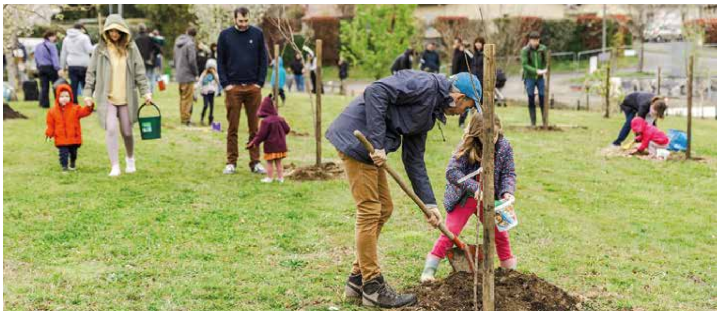
Des sourires, de la terre sur les mains et beaucoup de sens ! Les bébés de 2023 ont désormais leur arbre fruitier à Saint-Martin de Seignanx, planté en famille, lors de l'opération "Une naissance, un arbre" au Parc Maisonnave le 28 mars dernier.