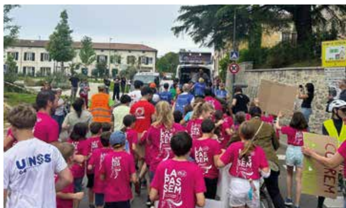
En 2022, Saint-Martin de Seignanx avait déjà accueilli la Passem au départ de la course.