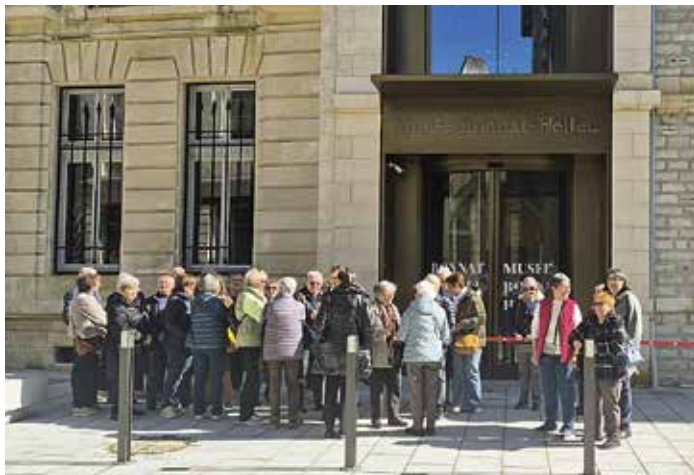
En février dernier, le CCAS de Saint-Martin de Seignanx proposait une sortie alliant découverte culturelle et mobilités pour les seniors en se rendant au musée Bonnat-Helleu de Bayonne en bus.