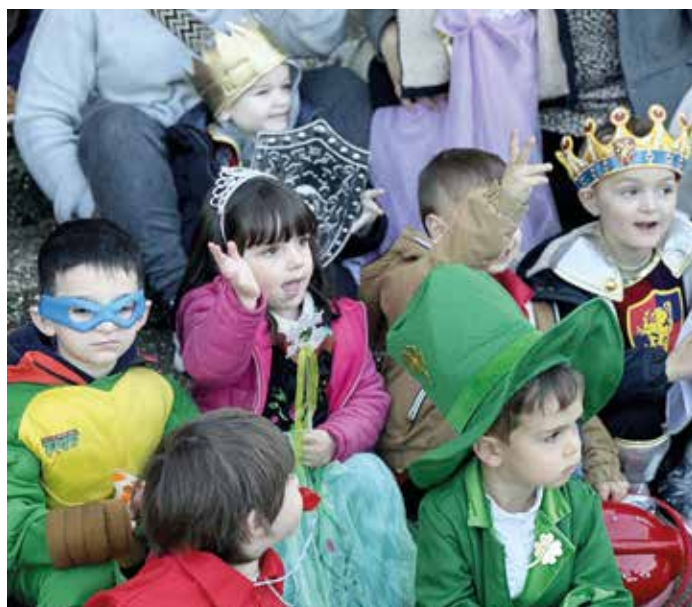
Princesses, super héros et autres pompiers et policières étaient au rendez-vous du défilé pour le carnaval des enfants de l'école maternelle, de la crèche et du RPE place Jean Rameau.

Comment traverser la route à pied ou en vélo ? A quel moment puis-je traverser ? Autant de questions auxquelles les enfants des écoles Saint-martinoises ont pu répondre lors des interventions de sensibilisation à la prévention routière proposées par la police municipale.