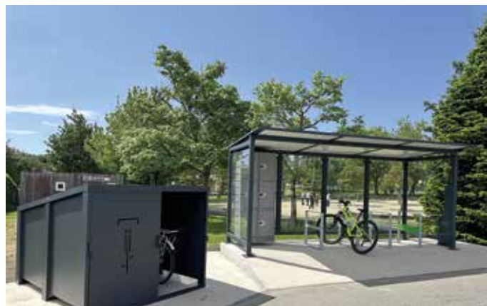
Équipements dédiés aux usagers du vélo