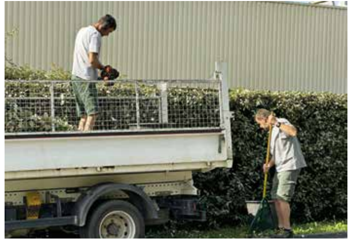
Les services espaces verts

Cet engagement, crucial pour les collectivités gestionnaires des bords de voirie, sera prochainement formalisé par la signature d'une charte de territoire.