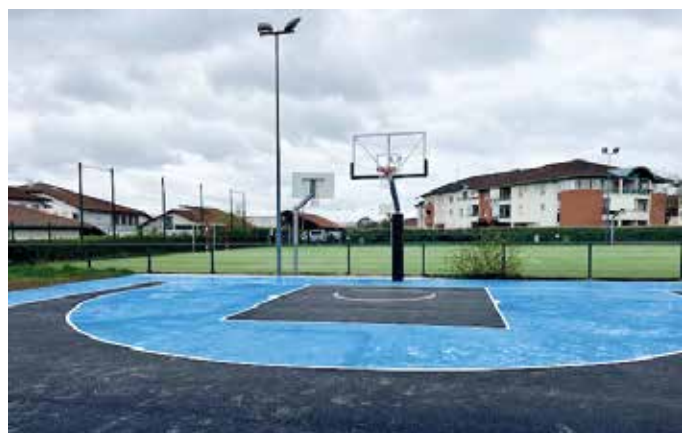
Le terrain de basket 3x3.