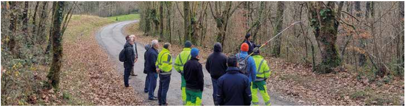
Lors de la formation en décembre dernier.