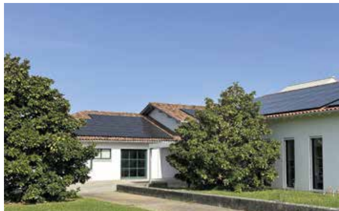
Panneaux photovoltaïques Gaston Larrieu Médiathèque.