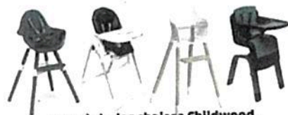
De g. à d.: les chaises Childwood, Peg Perego, Flexa et Nuna Zaaz.

infructueux au service client, je suis tombée sur un téléconseiller parlant mal le français qui a cherché à me convaincre, puis m'a proposé de ne payer que 49 €», explique-t-elle. Il lui faudra beaucoup d'obstination pour réussir à annuler l'abonnement. Elle croise désormais les doigts pour qu'aucun prélèvement ne soit effectué sur son compte. Dans le cas contraire, elle pourra toutefois demander à sa banque de la rembourser. ♦