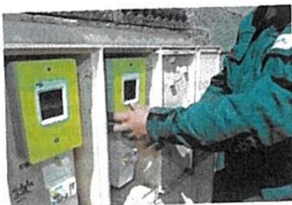
Pas plus de risques avec un compteur Linky qu'avec un chargeur d'ordinateur portable.

le rapport à venir de l'Agence sur l'électrosensibilité étant lui-même très attendu. Concernant Linky, les niveaux d'exposition, déjà reconnus faibles, devraient bientôt être précisés. À la demande de l'Anses, le CSTB (Centre scientifique et technique du bâtiment) effectue en ce moment des mesures en situation réelle. ♦